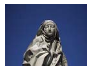
Ste Catherine de Sienne

Majestueuse basilique gothique du XIII ème siècle, qui domine le nord de la ville de Sienne. Elle renferme la très jolie chapelle dédiée à Sainte Catherine De Sienne. La petite chapelle contient la tête de la Sainte et sur la droite un portrait de Sainte Catherine, qui est à ce jour le seul portrait fidèle que l'on connaisse. A noter aussi les superbes fresques.